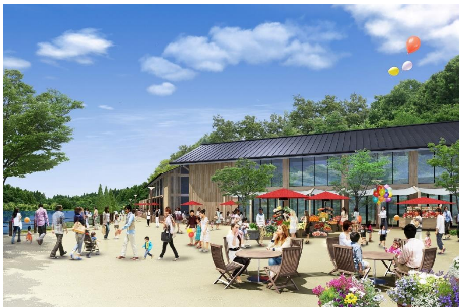
マーケット（イメージ）